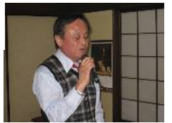
さぁ Rハンジ！次こそ…