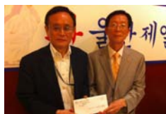
朴会長から義援金・・・