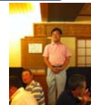
ゴルフグロス第2位 禹会長エレクト