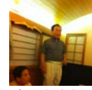
ゴルフ大会優勝 安パスト会長