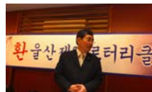
金パストガバナー挨拶