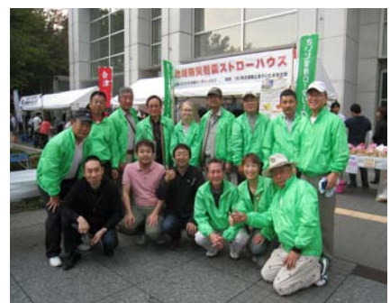
◀埼玉新聞で紹介されました▶